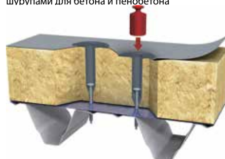
Выдерживает вес человека благодаря телескопической системе