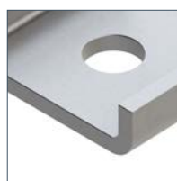
Высокая несущая способность