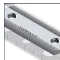
Свободное перемещение шайбы