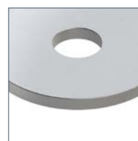
Увеличенный диаметр шайбы