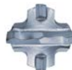
Наконечник бура SDS Max IV от ø 16 мм