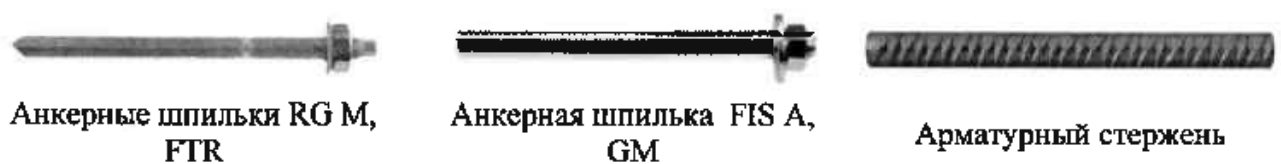
Рис. 3. Типы анкерных стержней fischer FIS EM Plus

2.5. Анкерным стержнем служит резьбовая шпилька либо арматурный стержень. Общий вид анкерных стержней отображен на рис. 3.