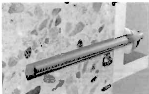
Рис. 1. Пример установки клеевых анкеров fischer FIS EM Plus с резьбовыми шпильками

2.3. Общий вид установленных клеевых анкеров в бетон представлен на рис. 1.