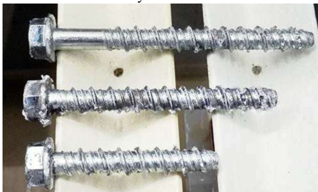
Спустя 72 ч.