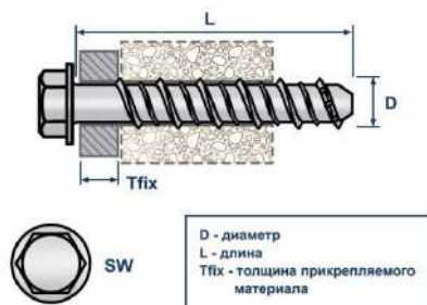
Шуруп по бетону с шестигранной головкой