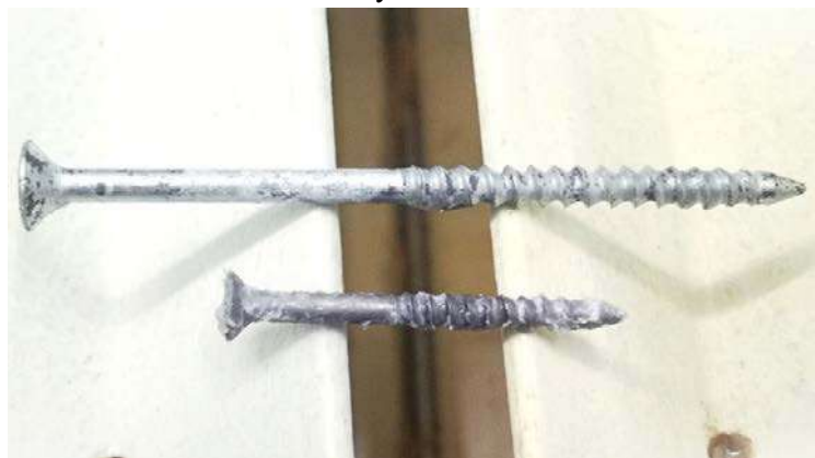
Спустя 72 ч.