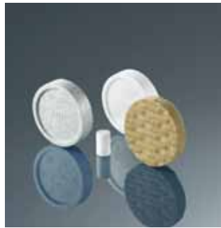
Рондели и заглушки STR стр. 16

Для продуктов группы ejothem STR U предлагается большой ассортимент комплектующих