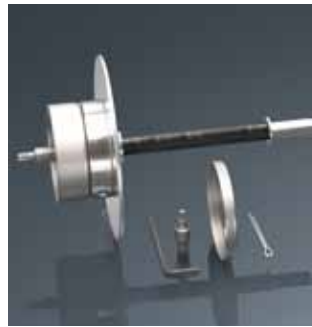
STR-tool 2G и комплектующие стр. 17