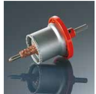
Ремонтная фреза STR стр. 19