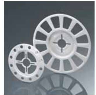
Комбинированная тарелка EJOT стр. 22