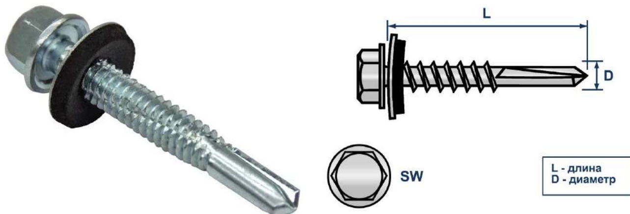
Фото и чертеж изделия