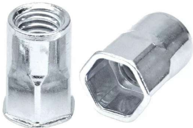
Фото и чертеж изделия