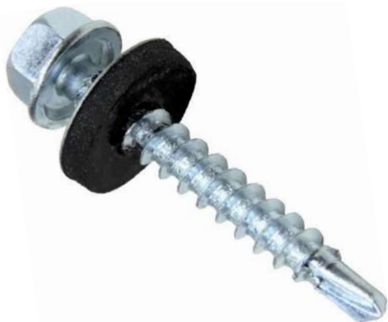
Фото и чертеж изделия