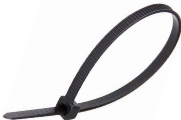
Фото и чертеж изделия