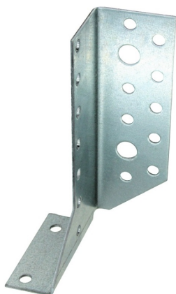
Фото и чертеж изделия