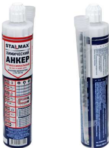
Фото изделия и таблица по отверждению