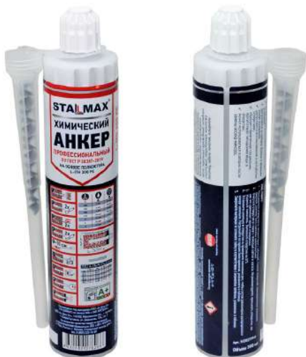
Фото изделия и таблица по отверждению