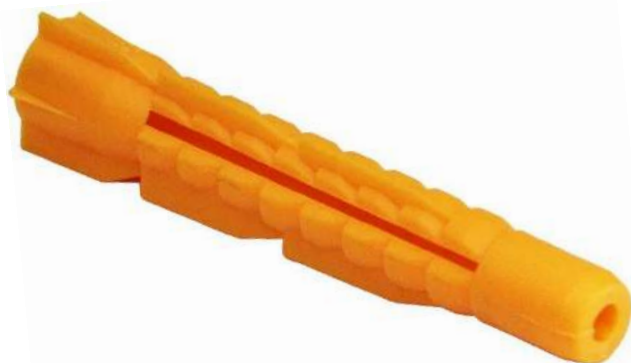
Фото и чертеж изделия