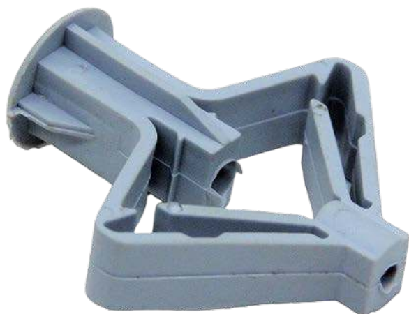
Фото и чертеж изделия