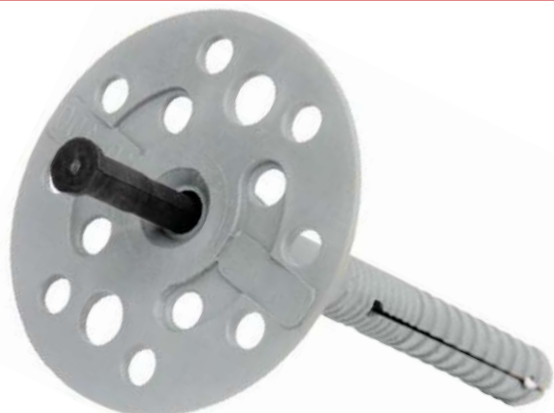
Фото и чертеж изделия