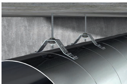
Крепление спирального воздуховода с помощью звукоизолирующей скобы