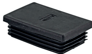
FEC 21 B