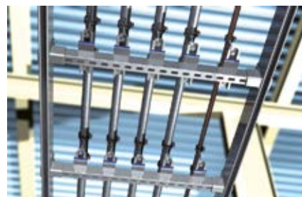
Скользящая опора на монтажной сетке