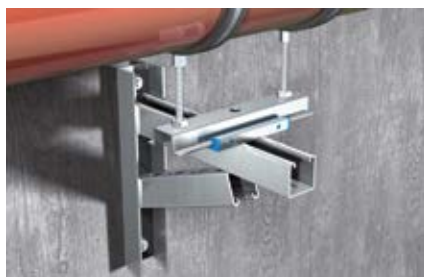
Скользящая опора, закрепленная на консоли