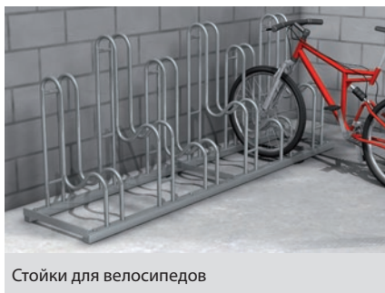
Стойки для велосипедов