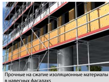
Прочные на сжатие изоляционные материалы в навесных фасадах