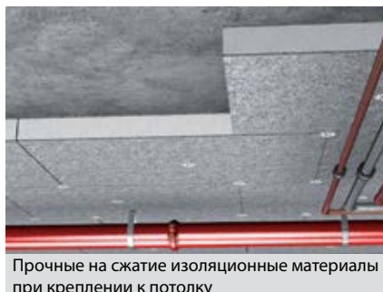
Прочные на сжатие изоляционные материалы при креплении к потолку