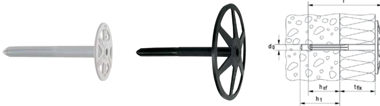
Дюбель для термоизоляции ДНК 45 , диаметр тарелки - \varnothing 45 мм