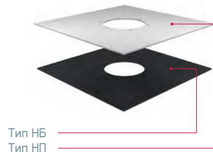
Тип НБ Тип НП

Фартук типа НБ изготовлен из полимер-битумного кровельного полотна, фартук типа НП — из полотна на основе ПВХ.