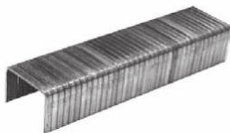
Скобы для степлера 85803