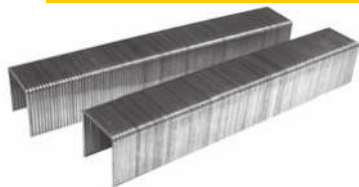
Скобы для степлера 85801, 85802