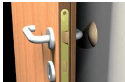
Ограничители хода дверей