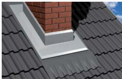
Покртия из листового металла