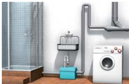
Водопроводные трубы с давлением до 1,5 бар