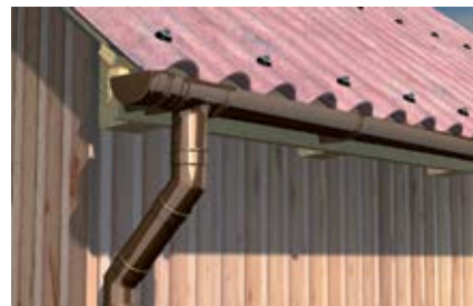
Водосточные трубы из ПВХ